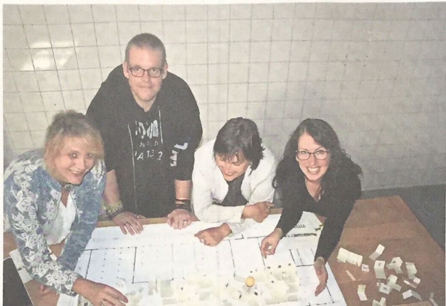
■ Het is een hele puzzel om de kunstenaars en hun werken een goede plek te geven in de expositie.

PROFESSIONEEL „En als we op nul beginnen dan doen we het gelijk in één keer goed“, opent Hindriks terwijl hij met zijn mede-organisatoren naar de maquette kijkt die een door-